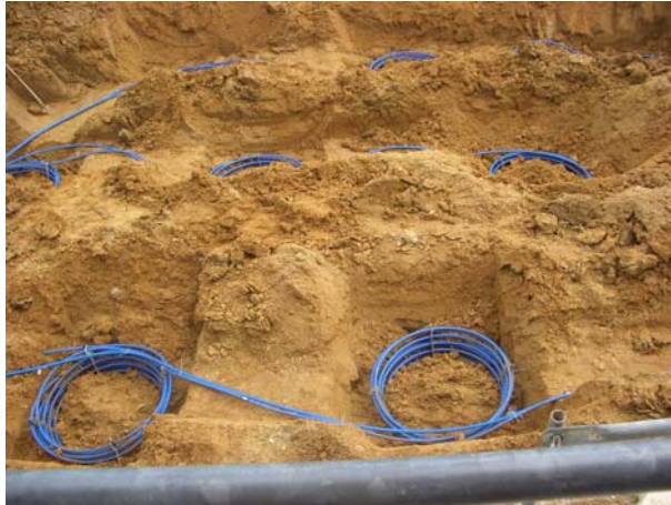
Bild einer angeschlossener 9- Korb Anlage