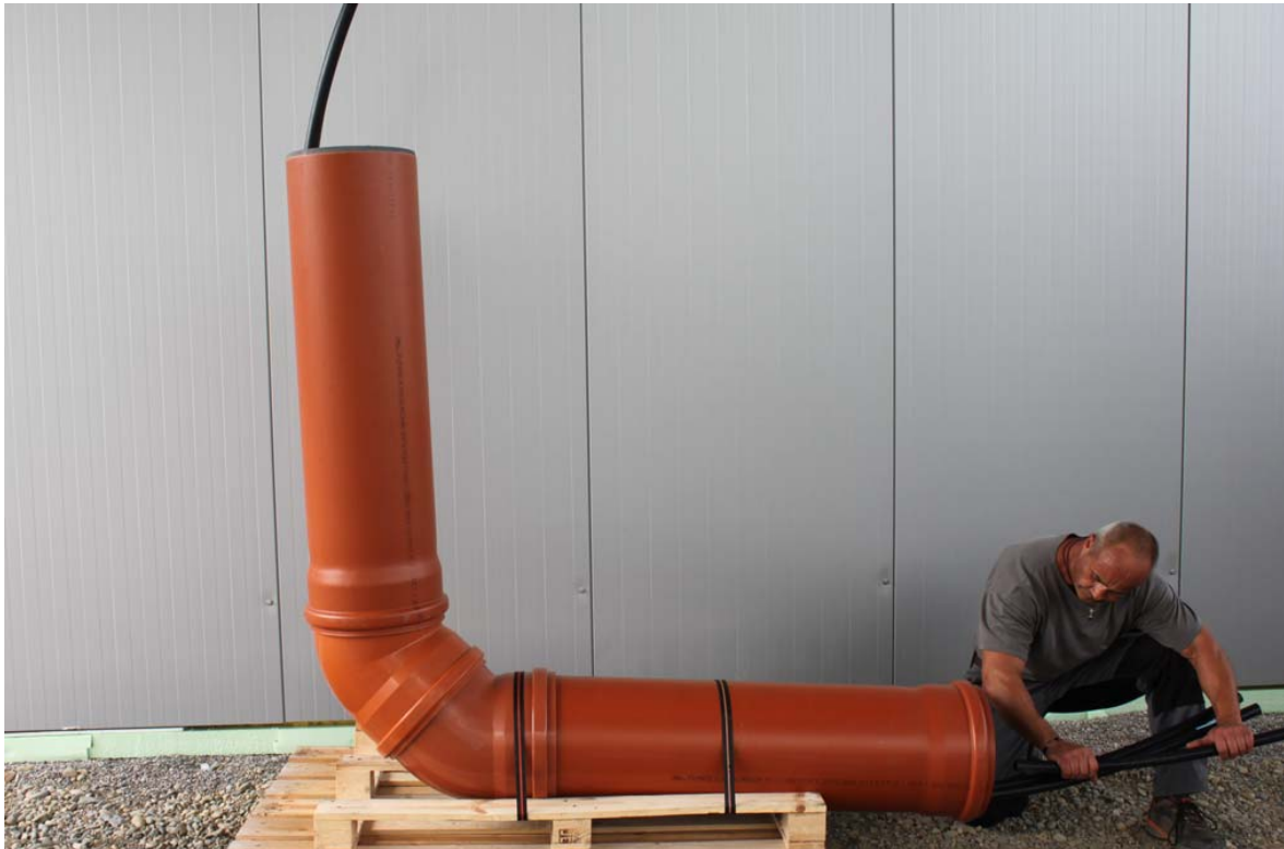
Abbildung 2: zur besseren Übersicht hier ohne Bodenplatte

2.1 Zusammengehörende Kreisläufe sowie Vor- und Rücklauf kennzeichnen.