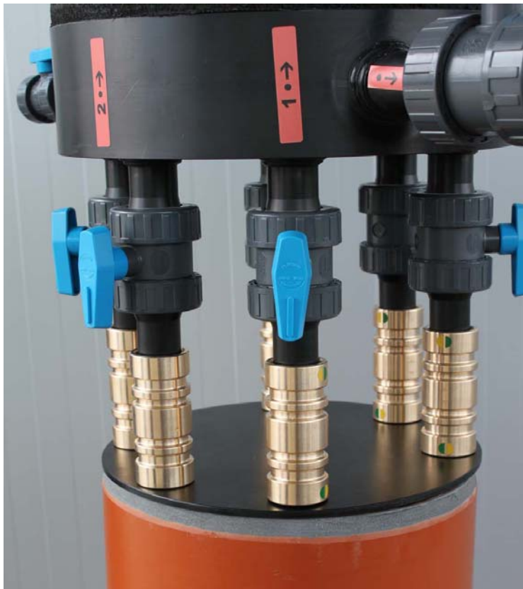
Abbildung 5: Verbinder auf Fixierscheibe