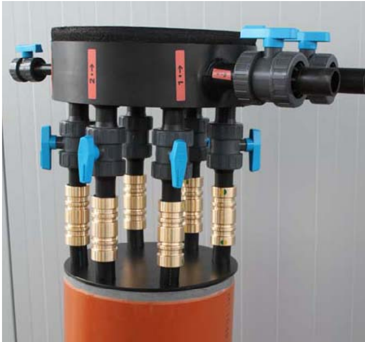
Abbildung 4: Verteilereinheit