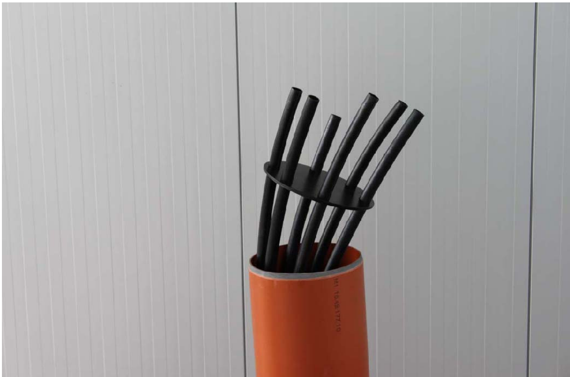
Abbildung 3: Fixierscheibe

3.1 Entweder ca. 10 cm Überstand oder einseitig Verbinder anbringen.